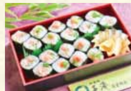
ねぎとろ巻き(3本) 1,500円