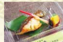
銀鱈の粕漬け焼き 720円