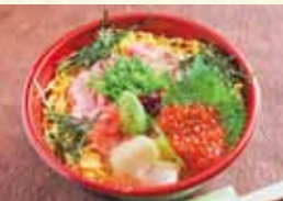
ねぎとろイクラ丼 1,920円