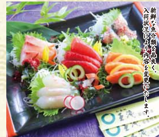
刺身盛り合わせ [3~4人前] 3,800円