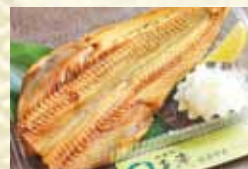
鱈ほっけの開き 950円