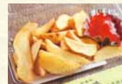
皮付きポテトフライ 420円