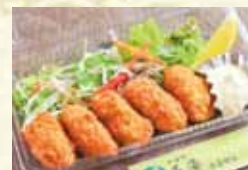
大粒カキフライ 780円