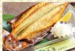
とろさばの開き 980円