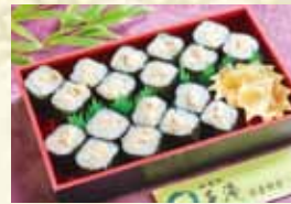
ツナマヨ巻き(3本) 840円