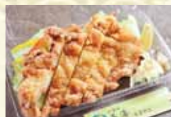
信州名物 山賊焼き 950円