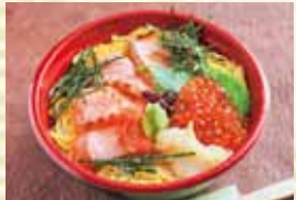
炙りサーモンイクラ丼 1,860円