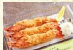
有頭海老フライ 980円