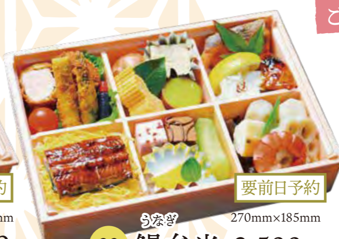
要前日予約 82 鰻弁当 2,500円