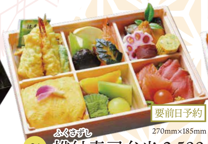
要前日予約 81 袱紗寿司弁当 2,500円