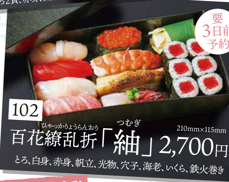
要3日前予約 102 百花繚乱折「紬」 2,700円