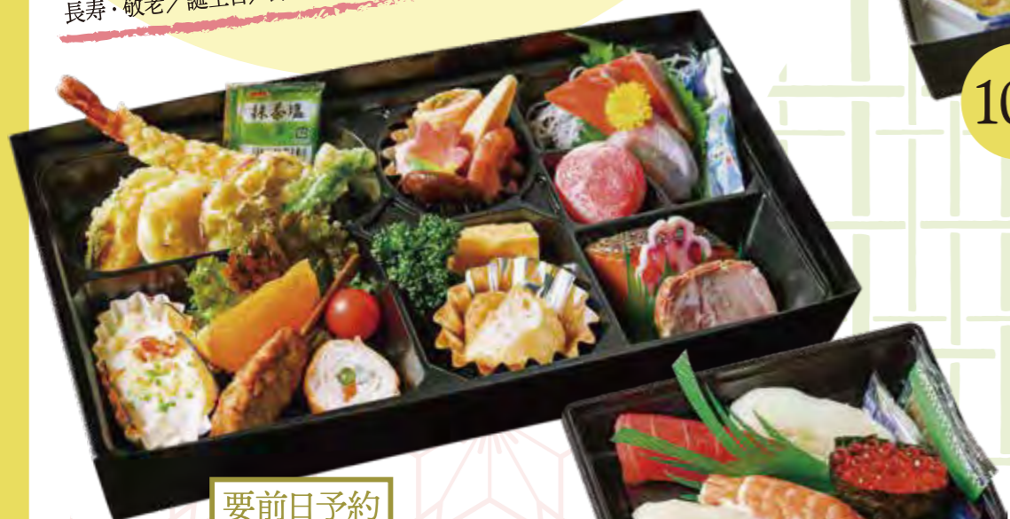
要前日予約 104 折詰め料理 3,780円

※価格は税込(宅配価格消費税8%込み)です。 ※写真はイメージです。入荷状況により内容が変更する場合があります。 ※配達エリア・料金等詳しくはお問い合わせください。 ※百花繚乱折は3日前・その他は前日迄のご予約となります。 ※ご注文が一定量を超えますとお受けできない場合があります。 ※百花繚乱折は12/29~1/7の間はご提供しておりません。 ※他メニューの年末年始配達についてはお問い合わせください。