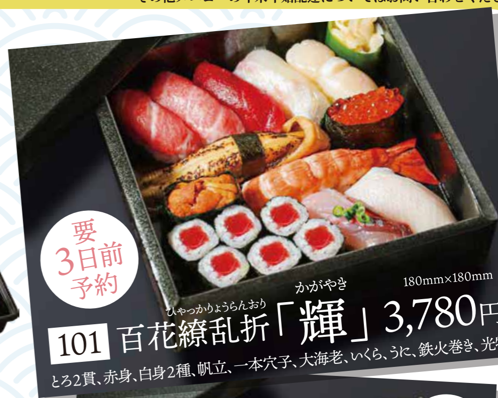
要3日前予約 101 百花繚乱折「輝」 3,780円