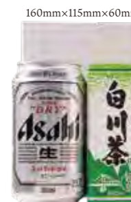
缶ビール・お茶 605円