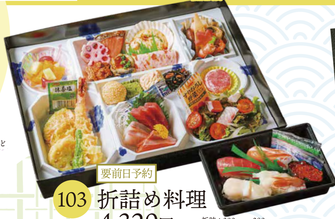
要前日予約 103 折詰め料理 4,320円