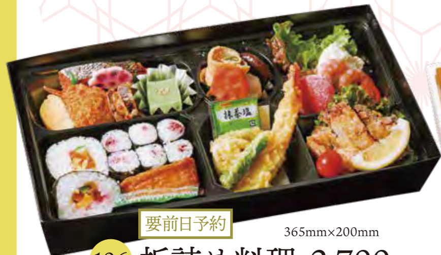
要前日予約 106 折詰め料理 2,700円