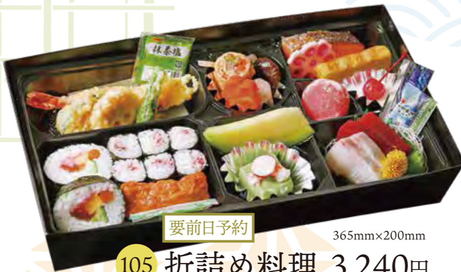
要前日予約 105 折詰め料理 3,240円