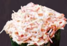
かに風味 サラダ軍艦