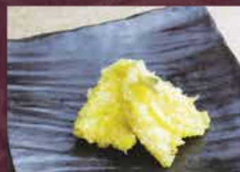
キヌ天 2尾 300円 (税込330円)