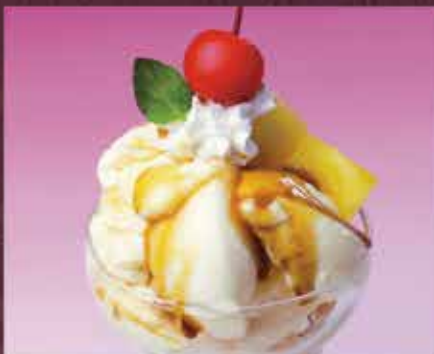
あっちゃんプリンパフェ 600円(税込660円)