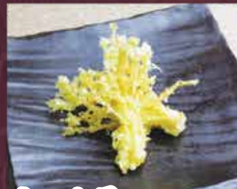
えのき天 約200g 150円 (税込165円)