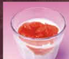
いちご杏仁 250円(税込275円)