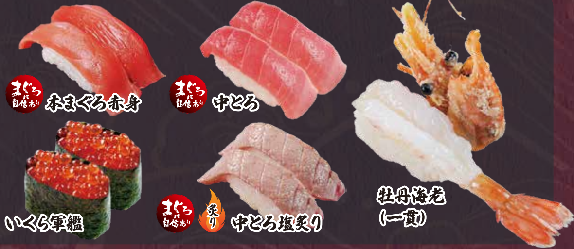
まぐろ 自信あり 本まぐろ赤身