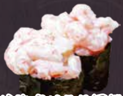
甘海老サラダ軍艦