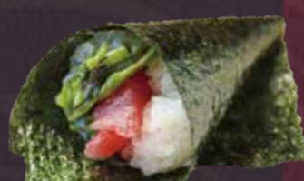
葉わさび鉄火巻き