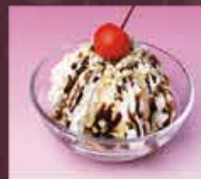
ミニチョコパフェ 300円(税込330円)