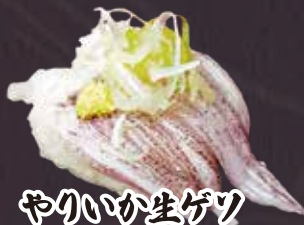
やういかに生ゲツ