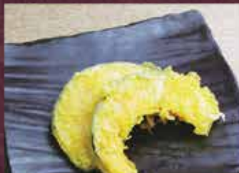
かぼちや天 2個 150円 (税込165円)