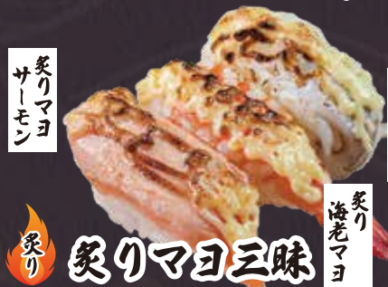
炙り サーモン 炙りマヨ