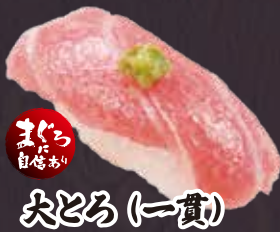
まぐら 自産あり 大とろ (一貫)