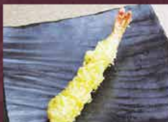
海老天 1尾 300円 (税込330円)