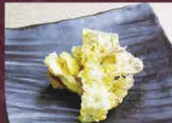
舞茸天 2個 150円 (税込165円)