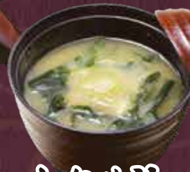
わかめ汁 150円(税込165円)