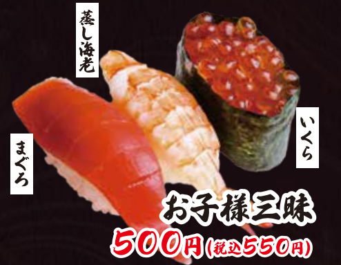
お子様三昧 500円(税込550円)