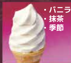
ソフトアイス 300円(税込330円)