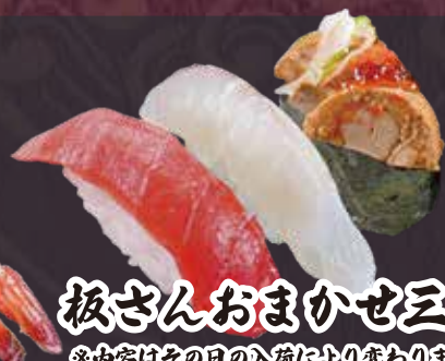
板さんおまかせ三昧