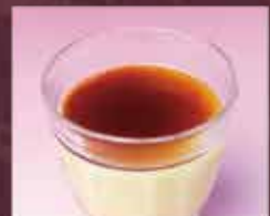
なめらかプリン 300円(税込330円)