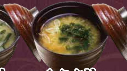
あおさ汁 150円(税込165円)