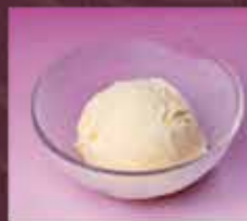
バニラアイス 250円(税込275円)