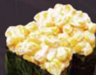
ユーン サラダ軍艦