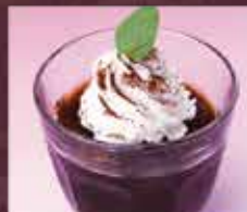
コーヒーゼリー 150円(税込165円)