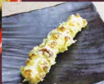
ちくわ天 1本 150円 (税込165円)