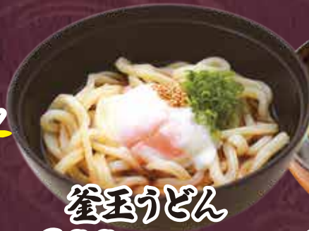
たまごうどん 300円(税込330円)