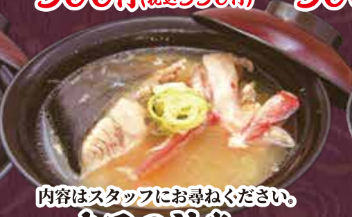
内容はスタッフにお尋ねください。 本日の汁物 250円(税込275円)