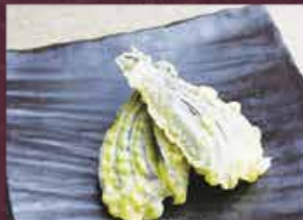
なす天 2個 150円 (税込165円)