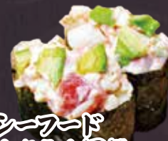
シーフード カクテル軍艦