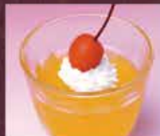
オレンジゼリー 150円(税込165円)