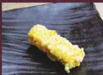
厚焼き玉子天 1本 300円 (税込330円)