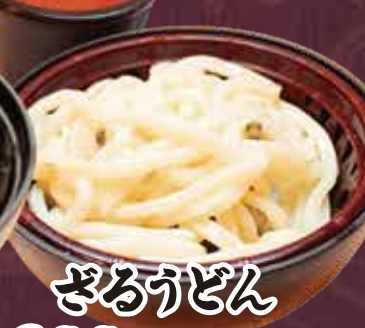
ざるうどん 300円(税込330円)