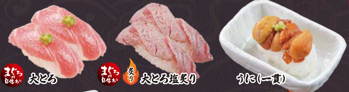
まぐろ 自信あり 大どろ