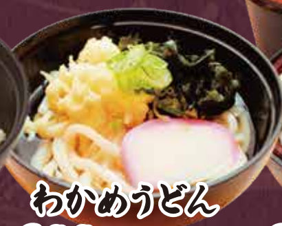
わかめうどん 300円(税込330円)