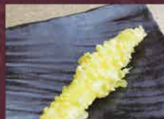
イカ天 1本 250円 (税込275円)