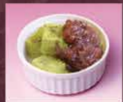
わらび餅 250円(税込275円)