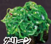
グリーン サラダ軍艦