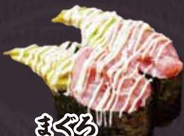
まぐろ アボカド軍艦