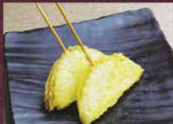
玉ねぎ天 1切 150円 (税込165円)