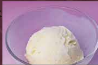
バニラアイス 250円 (税込275円)