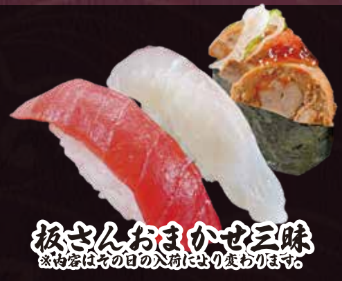
板さんおまかせ三昧 ※内容はその日の入荷により変わります。