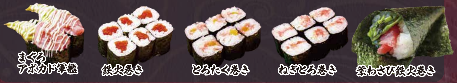
まぐろ アボカド軍艦 鉄火巻き とろたく巻き わぎとろ巻き 紫わさび鉄火巻き