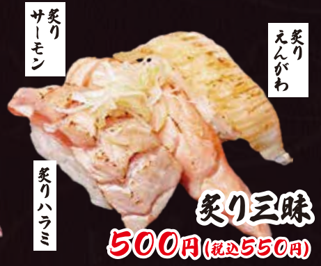
炙り三昧 500円(税込550円)