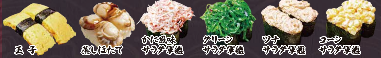
玉子 蒸しほたて かに風味 サラダ軍艦 グリーン サラダ軍艦 ワナ サラダ軍艦 ユーシ サラダ軍艦