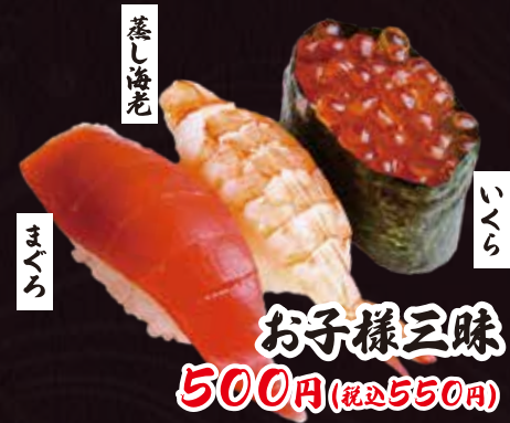
お子様三昧 500円(税込550円)