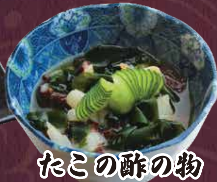
たこの酢の物 300円(税込330円)