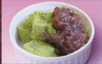
わらび餅 250円 (税込275円)