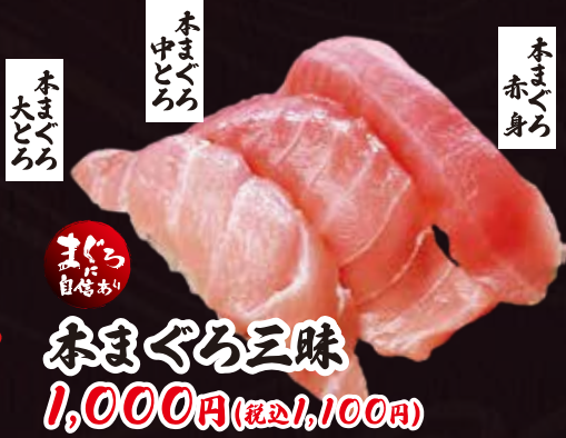
本まぐろ三昧 1,000円(税込1,100円)