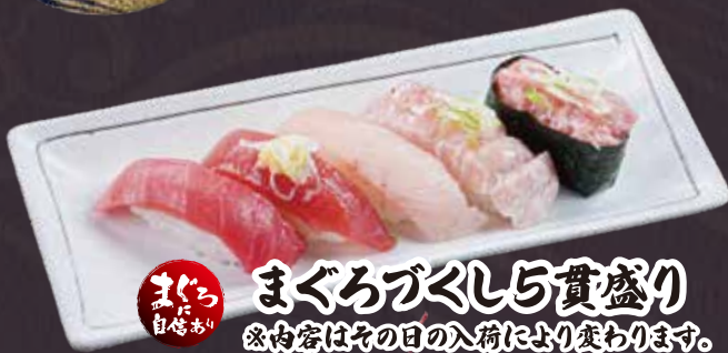
まぐろ まぐろづくし5貫盛り ※内容はその日の入荷により変わります。