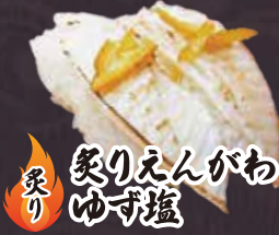
炙り 炙りえんがわ ゆず塩