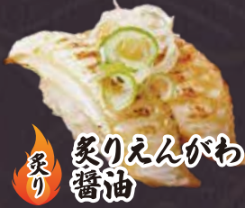
炙り 炙りえんがわ 醤油