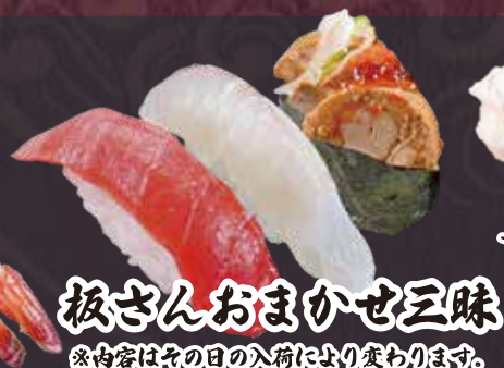
板さんおまかせ三昧