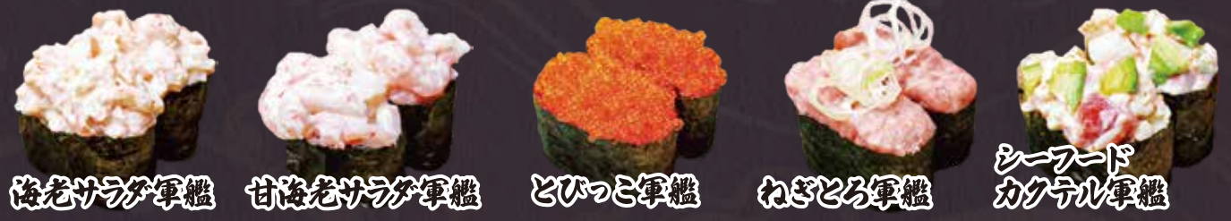
海老サラダ軍艦 甘海老サラダ軍艦 とびっこ軍艦 わぎとろ軍艦 シーフード カクテル軍艦