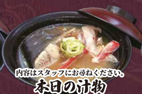
内容はスタッフにお尋ねください。 本日の汁物 250円(税込275円)