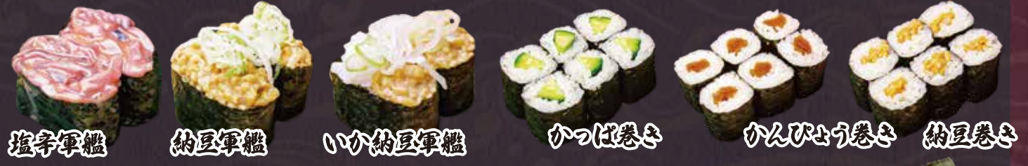
塩辛軍艦 納豆軍艦 いか納豆軍艦 かつば巻き かんぴょう巻き 納豆巻き