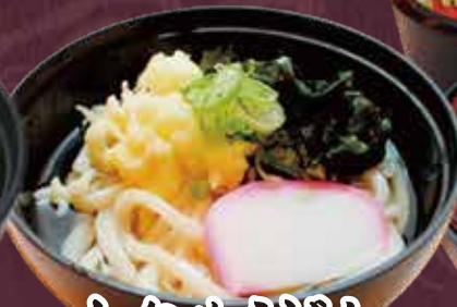
わかめうどん 300円(税込330円)