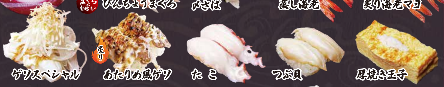
ゲリスベシヤル あたりめ風ゲツ たこ つぶ貝 厚焼き玉子