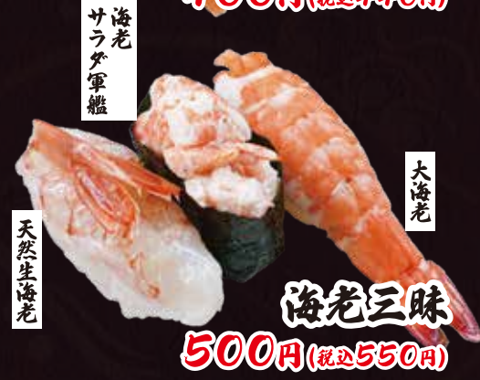
海老三昧 500円(税込550円)