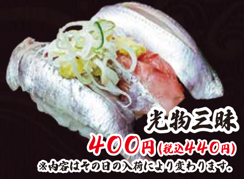
光物三昧 400円(税込440円) ※内容はその日の入荷により変わります。