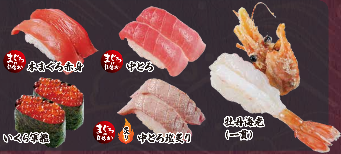
まぐろ 本まぐろ赤身