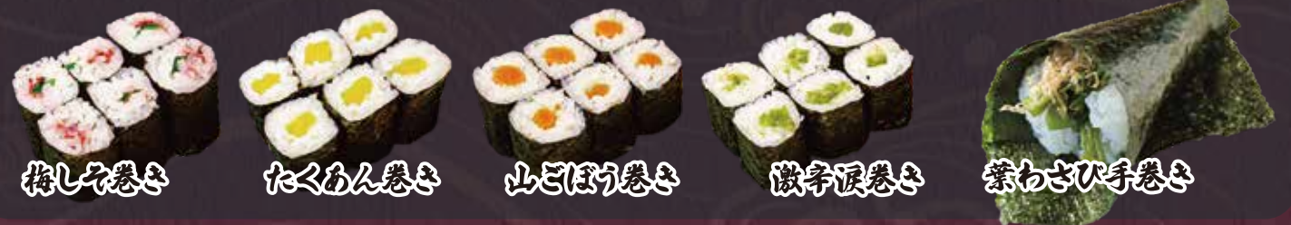
梅しそ巻き たくあん巻き 山ごぼう巻き 激辛涙巻き 紫わさび手巻き