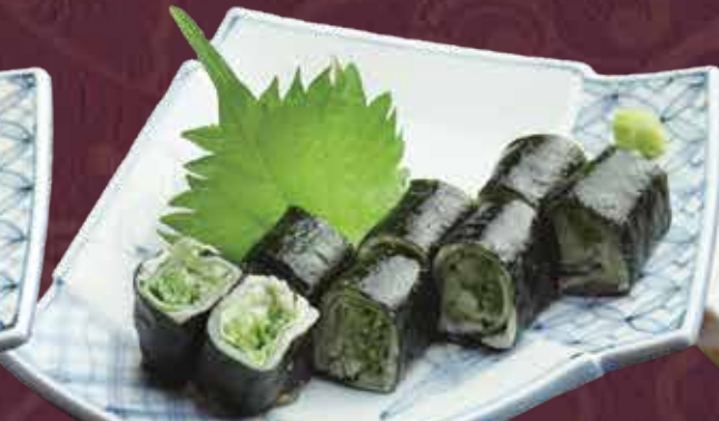
とろめさばがりしそ巻き 600円(税込660円)