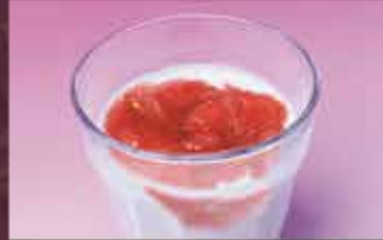
いちご杏仁 250円 (税込275円)