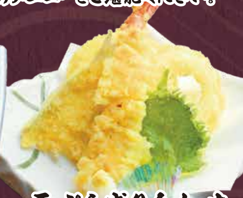
天ぷら盛り合わせ 800円(税込880円) ※内容はその日の入荷によって変わります。