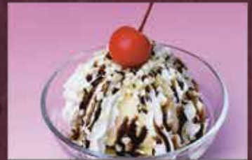
ミニチョコパフェ 300円 (税込330円)