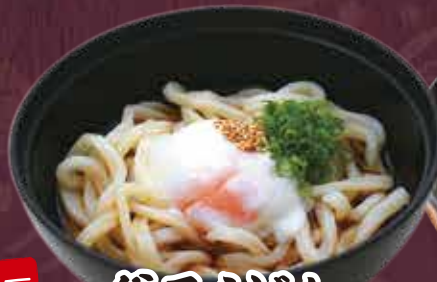
釜玉うどん 300円(税込330円)