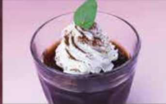
コーヒーゼリー 250円 (税込275円)