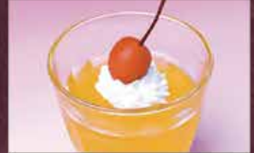
オレンジゼリー 150円 (税込165円)