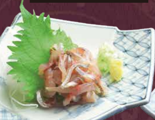
あじのたたき 600円(税込660円)