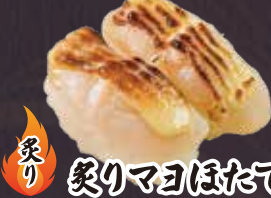
炙り 炙りマヨほたて