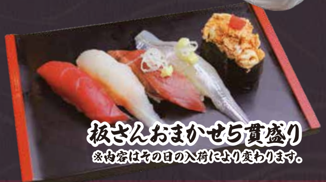
板さんおまかせ5貫盛り ※内容はその日の入荷により変わります。