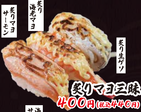
炙りマヨ三昧 400円(税込440円)