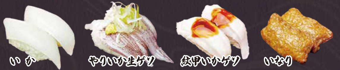
いか やりいか生ゲツ 紋甲いかゲツ いなり