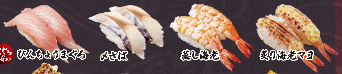
まぐろ びんちようまぐろ みさば 蒸し海老 炙り海老マヨ