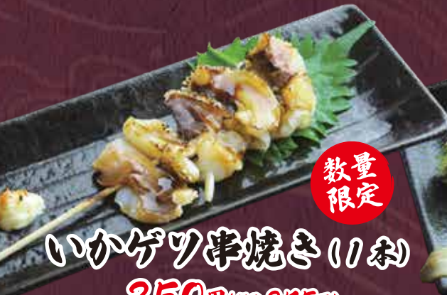
いかゲツ串焼き(1本) 250円(税込275円)