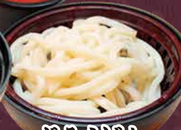
ざるうどん 300円(税込330円)