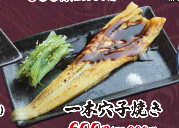
一本穴子焼き 600円(税込660円)