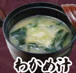
わかめ汁 150円(税込165円)