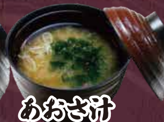
あおさ汁 150円(税込165円)