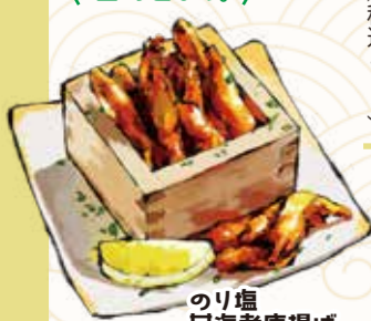
のり塩 日海老唐揚げ