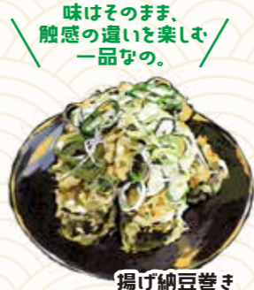
味はそのまま、 触感の違いを楽しむ、 一品なの。